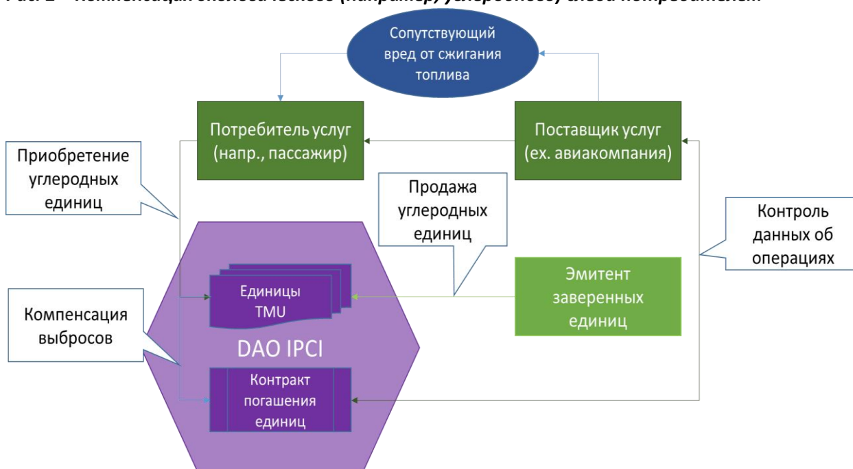
Рис. 2 – Компенсация экологического (например, углеродного) следа потребителем

Более подробную информацию, процедуры, схемы и руководства см. в разделе «Руководства» на сайте www.ipci.io .