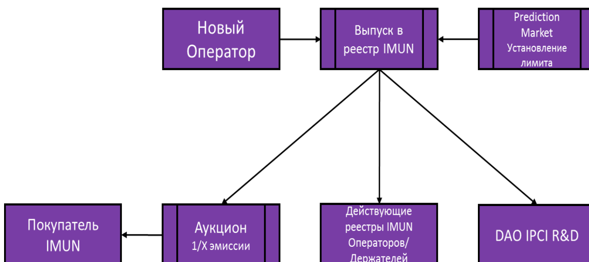
Рис. 3 – Выпуск внутреннего оборотного токена IMUN

Для обеспечения интересов держателей IMUN и предотвращения размывания ценности единиц, выпущенных ранее, существенная часть вновь выпускаемых единиц IMUN будет распределена пропорционально между реестрами IMUN прежних держателей и операторов, а также в целях исследований и развития DAO IPCI. Поступления от эмиссии остальной части токенов IMUN также предназначены для некоммерческих целей и поступают в распоряжение нового Оператора, осуществившего эмиссию. Например, поступления от \frac{1}{2} объема выпуска второго оператора, \frac{2}{3} выпуска третьего нового оператора и т.д.