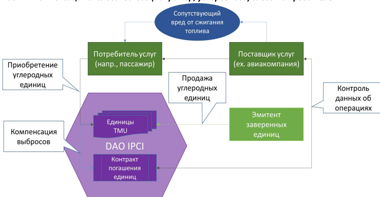
Рис. 2 – Компенсация экологического (например, углеродного) следа потребителем

Более подробную информацию, условия пользования и комиссии, процедуры, схемы и руководства см. в разделах «Основные условия пользования и комиссии» и «Руководства» на сайте ipci.io .